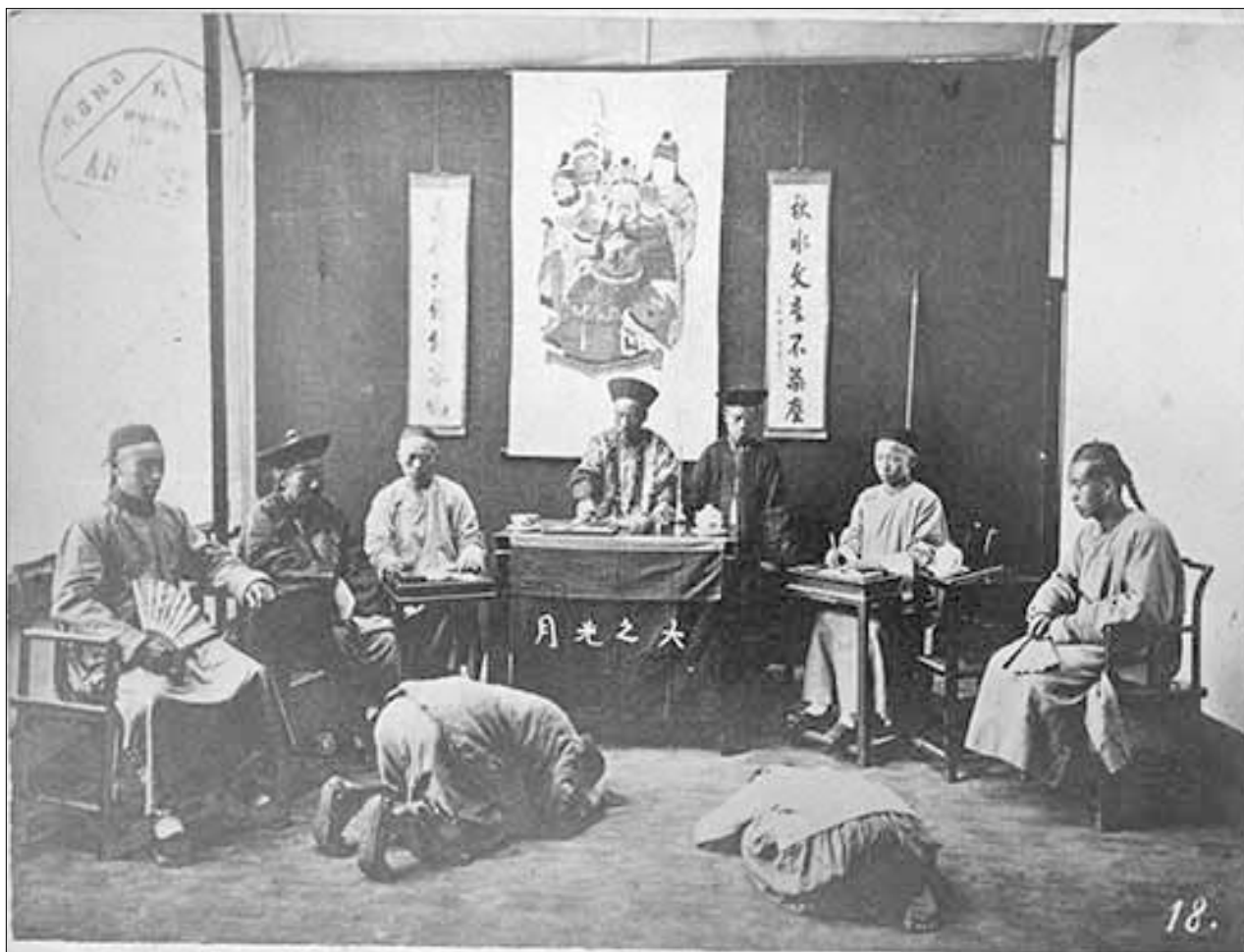
Рис. 1. Внутренность комнаты китайского дома и мебелировка. Экземпляр Российской государственной библиотеки [1]

с Матусовским 3 не удалось пользоваться ею, и мы знали, что не получим ни одного снимка из всего путешествия (как и вышло). Вот почему приходилось покупать их здесь (в Шанхае. — А. К.), дорогой ценой, у фотографа Саундерса, который тут один, дальше же, я знал, достать будет негде» [10, с. 269].