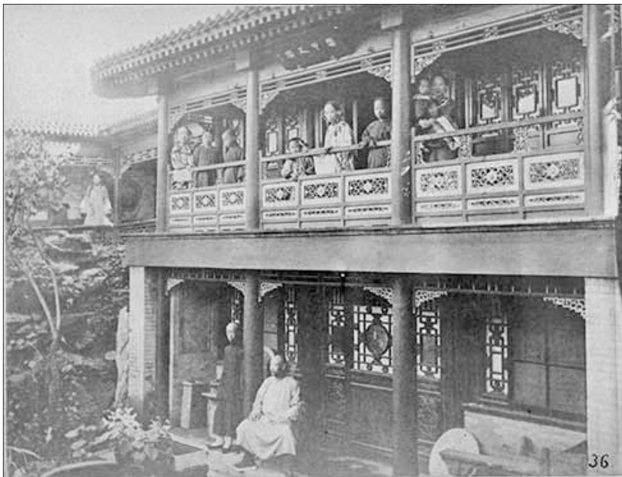
Рис. 2. Дом богатого китайца Ян-фан. Экземпляр Российской государственной библиотеки [1]

ные дела: они рассчитывали продать 1000 фотографических альбомов, которые по итогам поездки должен был составить А. Боярский, по 100 руб. за альбом и тем самым заработать на двоих колоссальную сумму в 100 тыс. руб. [11, с. 28]. Так Ю.А. Сосновский оказался зависим от А. Боярского, которому «стоило только сложить руки или уничтожить сделанные негативы, и сто тысяч рассеиваются, как мираж» [11, с. 29].