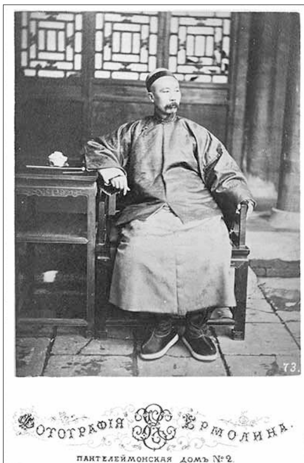
Рис. 5. Портрет Ли-Чжун-Тана, генерал-губернатора провинции Чжи-Ли. Экземпляр Российской государственной библиотеки [1]

ля; Томаса Чайлда (Thomas Child, 1841–1898), английского «полупрофессионального» фотографа и газового инженера; Джона Даджона (John Dudgeon, 1837–1901), шотландского фотографа-любителя и врача-миссионера (по крайней мере, ему приписывается несколько фотографий, скопированных Н.А. Ермолиным); Лоренцо Фислера (Lorenzo F. Fisler, 1841–1918), американского фотографа итальянского происхождения; майора Уотсона (James Crombie Watson, 1833–1908), австралийского фотографа-любителя и офицера.