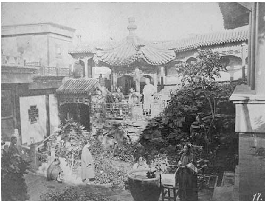
Рис. 6. Сад при доме зажиточного человека. Экземпляр Российской государственной библиотеки [1]

Фотография № 58 (табл.) «Мост для пешеходов в загородном парке близ Пекина» (рис. 3), оригинал которой принадлежит шотландскому фотографу Т. Чайлду, отчетливо напоминает акварель П.Я. Пясецкого «Мост в Пекине» (Государственный Эрмитаж, инв. № ЭРР-8491). И снимок, и рисунок не просто изображают один и тот же архитектурный