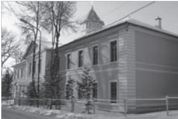
Казарма Дорогобужского полка

Составляя доминанту культурного ландшафта и концентрируя в себе основные атрибуты истории и культуры города, Покровская гора исследуется учеными, отражается в местной мифологии, художественном творчестве, публицистике. В брянском тексте раскрывается семиотика исторического расположения города на Покровской горе, осмысливаемой как «метафора онтологической вертикали» [21]. Ее содержательная емкость усиливается в результате восприятия на фоне окружающего ландшафта: это «место, самой природой защищенное с трех сторон крутыми оврагами» [22, с. 22], а с четвертой — рекой Десной. Неслучайно здесь для утверждения княжеской власти и распространения христианства в 988 г. был основан город-крепость, который, по мнению Е.А. Шинакова, мог быть одним из центров христианизации по направлению Стародуб — Вщиж — Брянск [23, с. 46]. С начала XVI в. он занял «важное место в оборонительной системе Русского государства» [24, с. 9].