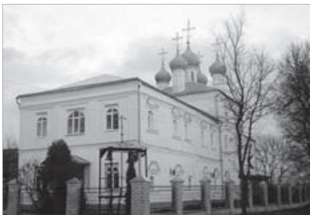
Церковь Покрова Пресвятой Богородицы

нинский край» [4]. Н.М. Грибачев называет Брянщину «Отчизной Пересвета и Бояна». Эти гении места выступают в качестве «фактора формирования образа, некоей духовной проекции места, его одухотворения» [5]. Как выразители культурных приоритетов региона они организационно оформляют и задают основные направления его духовной деятельности.