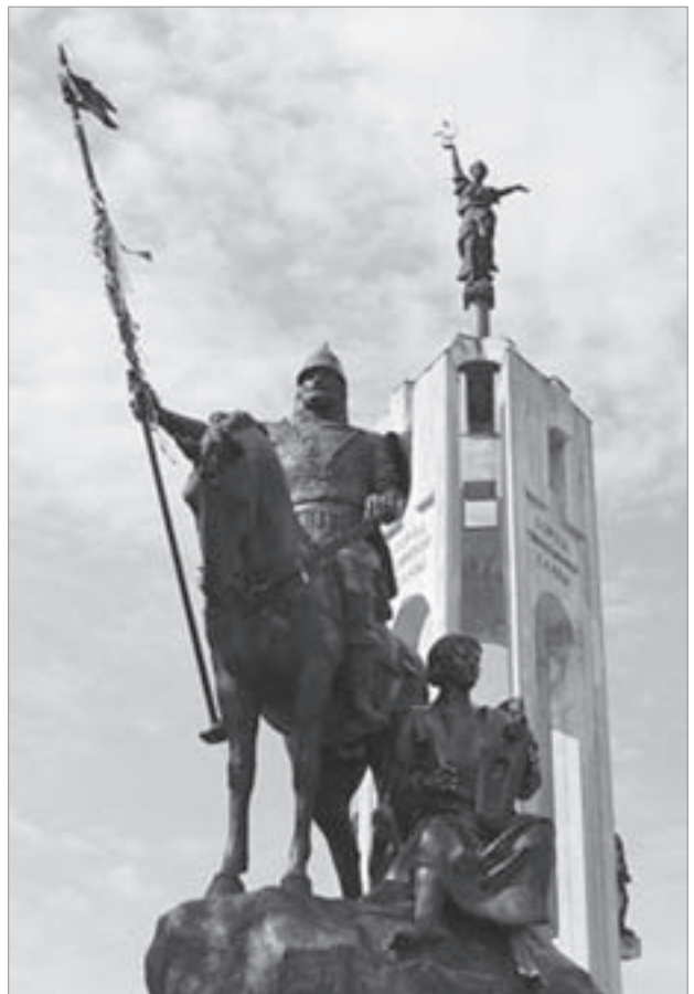
Мемориал, состоящий из скульптурной группы «Пересвет и Боян» и стелы с фигурой Родины-матери