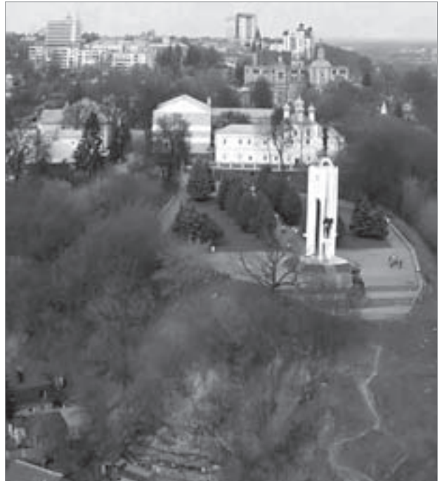
Вид на Покровскую гору

Особую роль в мифологизации Покровской горы сыграл юбилейный 1985 г. и мероприятия, связанные с празднованием 1000-летия Брянска. Среди наиболее заметных событий отметим открытие здесь мемориального комплекса, в котором было закреплено разнообразие тем, сложившихся к этому времени в брянском тексте: 1000-летней истории города, его военной и литературной судьбы, революционного прошлого и трудовой славы. На самой высокой точке географического ландшафта — более чем 40-метровом «мысу, образованном правым берегом реки Десны, оврагом Верхний Судок и первым северным ответвлением этого оврага» [3, с. 53], была установлена скульптурная композиция, состоящая из сидящего на коне древнего воина в боевом снаряжении, со щитом и пикой и Бояна с гуслими (авторы — лауреат Ленинской и Государственной премий, заслуженный скульптор РСФСР Ю.Г. Орехов, лауреаты Государственной премии, заслуженные архитекторы РСФСР А.В. Степанов и В.А. Петербужцев). Воина на коне в народе и официальных источниках (прежде всего в СМИ) очень быстро нарекли именем брянского гения места Пересвета, что вряд ли соответствует логике истории: Пересвет, скорее, мог быть в монашеской рясе, а не в кольчуге. Но в нашем случае соотношение поэта и воина, воплощенных в камне, с персонажами местной истории подтверждает мысль о значимости достижений брянцев в военной и литературной деятельности. Пересвет и Боян — ключевые образы брянского текста: «В звоне былинного ветра / Гусли Бояна узнай, — / Это земля Пересвета, / Это суса-