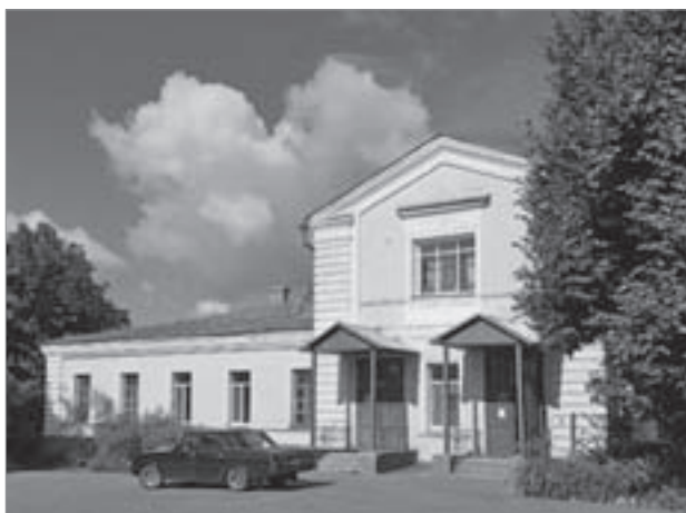
Дом генерал-директора Брянского Арсенала

На особую значимость тем мирного и ратного труда в брянском тексте указывают и две постройки XVIII в. — жилая и казарменная. Первая — дом генерал-директора и офицеров Арсенала — напоминает о близком присутствии завода, расположенного у подножия Покровской горы. Символично, что в этом доме подолгу гостил у своего дяди, полковника Н.Г. Высочанского, К.Г. Паустовский: «Сани остановились около деревянного дома на склоне горы» [20, с. 161]. Вторая — двухэтажное каменное здание казарм Дорогобужского полка, вписавшего интереснейшие страницы в военную историю Брянска. Оба этих памятника архитектуры выполнены в стиле раннего классицизма и дают представление о градостроительной культуре города.