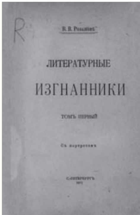
Обложка книги В.В. Розанова «Литературные изгнанники» [3]

Авторский том «Литературных изгнанников» в 2001 г., благодаря усилиям А.Н. Никулиной, был