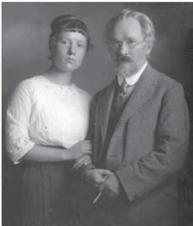
В.В. Розанов с дочерью Верой. Санкт-Петербург. 1913 г. (ОР РГБ. Ф. 249. К. 10. Ед. хр. 23. Л. 1)

Последний прижизненный дар писателя Румянцевскому музею в 1918 г. носил уже на себе отпечаток нестабильности революционного времени. Основную массу папок составили письма отдельных корреспондентов, несколько блоков уже не были подшиты, а просто сложены в большие конверты. Например, под номером М. 4217 Музейного собрания значился конверт с письмами, собранными писателем для будущей публикации в третьем томе его книги «Семейный вопрос в России». Их содержимое даритель обозначил как «Письма В.В. Розанову разных лиц, или практически нуждающихся, или теоретически заинтересованных, касательно брака...».