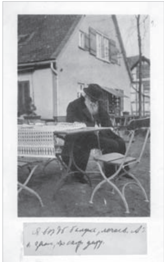
Литография А.С. Суворина с подклеенным ниже его автографом: «Я ведь балуюсь, лечась. А я знаю, что скоро умру». Франкфурт-на-Майне. 1911 г. Из книги В.В. Розанова «Письма А.С. Суворина к В.В. Розанову» [11] (ОР РГБ. Ф. 249. К. 11. Ед. хр. 17. Л. 1—2)

Ко второму этапу выхода в свет эпистолярного наследия В.В. Розанова можно отнести последующие публикации писем исследователями творчест-