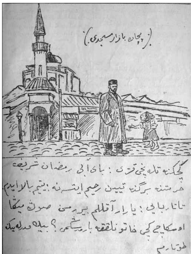
Рис. 2. Изображение Сенной мечети. Карикатура из журнала «Ялт-юлт» (1911. № 54)

«Яшен» — в типографии Каримовых, «Ялт-юлт» — в типографии Харитонов (позже была переименована в «Умид»). Журналы представляют сшитые из нескольких страниц тетради, где первая — титульная страница, далее — тексты с карикатурами (либо фотографией), на последней странице представлены объявления и реклама.