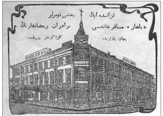
Рис. 3. Гостиница «Булгар». Иллюстрация к рекламному объявлению в журнале «Ялт-юлт» (1913. № 56)

Уже к XIX в. площадь Сенного базара была застроена по периметру купеческими лавками, складами, доходными домами [13,