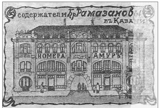
Рис. 4. Гостиница «Амур». Иллюстрация к рекламному объявлению в журнале «Ялт-юлт» (1913. № 56)

с. 36]. Пространство перед мечетью пользовалось у горожан дурной славой. Здесь совершались торговые сделки, продавцы обманывали покупателей. Грязная, должным образом не освещавшаяся рыночная площадь, заваленная мусором, представляла одновременно пугающее зрелище, особенно в вечернее время. Именно эту атмосферу передает художник в журнале «Ялт-юлт» (1913. № 54), карикатурно изображая площадь, прилегающую к Сенному базару, передавая содержание фельетона, призывающего обратить на это явление внимание горожан.