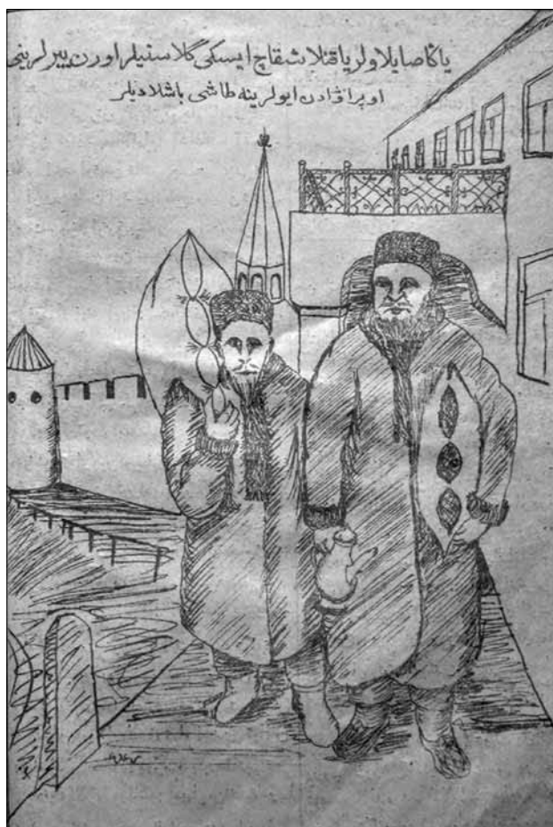
Рис. 5. Изображение фрагмента каменного моста через ров, соединяющий Кремль и улицу Воскресенскую. Действие происходит на фоне здания Казанской Городской думы и башен Кремля. Карикатура из журнала «Яшен» (1908. № 4)

метафорой для того, чтобы усилить содержание текста, акцентировать его сарказм.